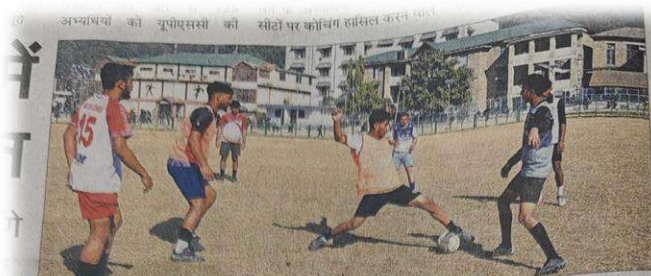
मंडी के पड्डल मैदान में हिमाचल प्रदेश विश्वविद्यालय की फुटबाल टीम अभ्यास करते हुए।