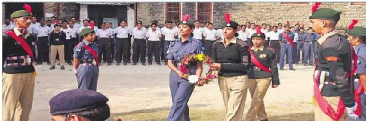
The wreath-laying ceremony in progress; and (below) the martyr's wife being honoured in Mandi on Sunday.