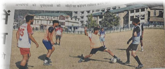
मंडी के पडल मैदान में हिमाचल प्रदेश विश्वविद्यालय की फुटबाल टीम अभ्यास करते हुए। संवाद